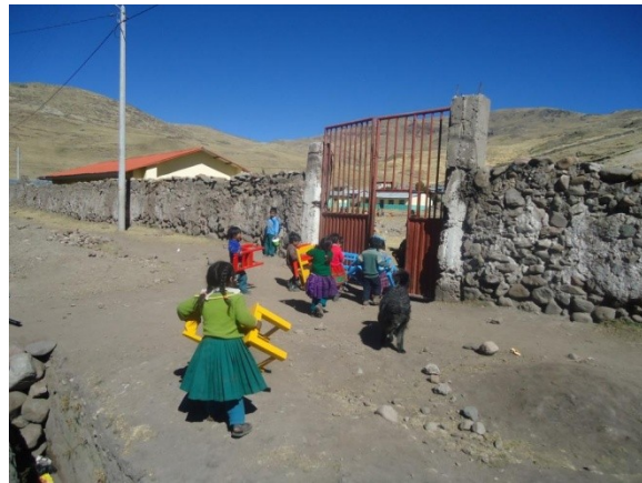
Schoolmeubeltjes voor Alhuacchayo

Mocht je vragen hebben over de besteding van jullie bijdrage dan kun je mij altijd schrijven.